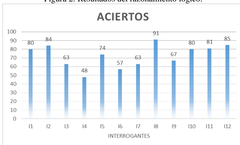
Figura 2. Resultados del razonamiento lógico.

La figura 3, que muestra los resultados en cuanto al razonamiento numérico tiene un comportamiento similar, exceptuando los casos de las interrogantes 5 y 6, donde más de la mitad