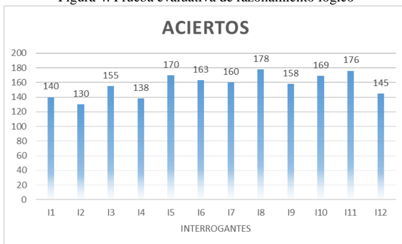
Figura 4. Prueba evaluativa de razonamiento lógico

La figura 5, tiene un escenario similar, se actualizaron los conocimientos de matemáticas y los estudiantes reflejaron un rendimiento superior con respecto al anterior. Ambos nuevos rendimientos permiten justificar este de actividades en zonas rurales donde existen falencias en