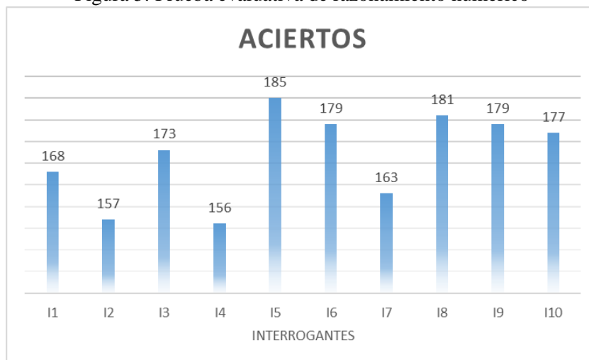
Figura 5. Prueba evaluativa de razonamiento numérico

Las sesiones presenciales permitieron que parte de los estudiantes que no tenían acceso a los recursos como el internet pueden también recibir la capacitación. Se compartieron textos relevantes con un gran número de ejercicios de distinta complejidad para motivar a los estudiantes a desarrollar un aprendizaje autónomo de este razonamiento usando como base lo aprendido durante las sesiones.